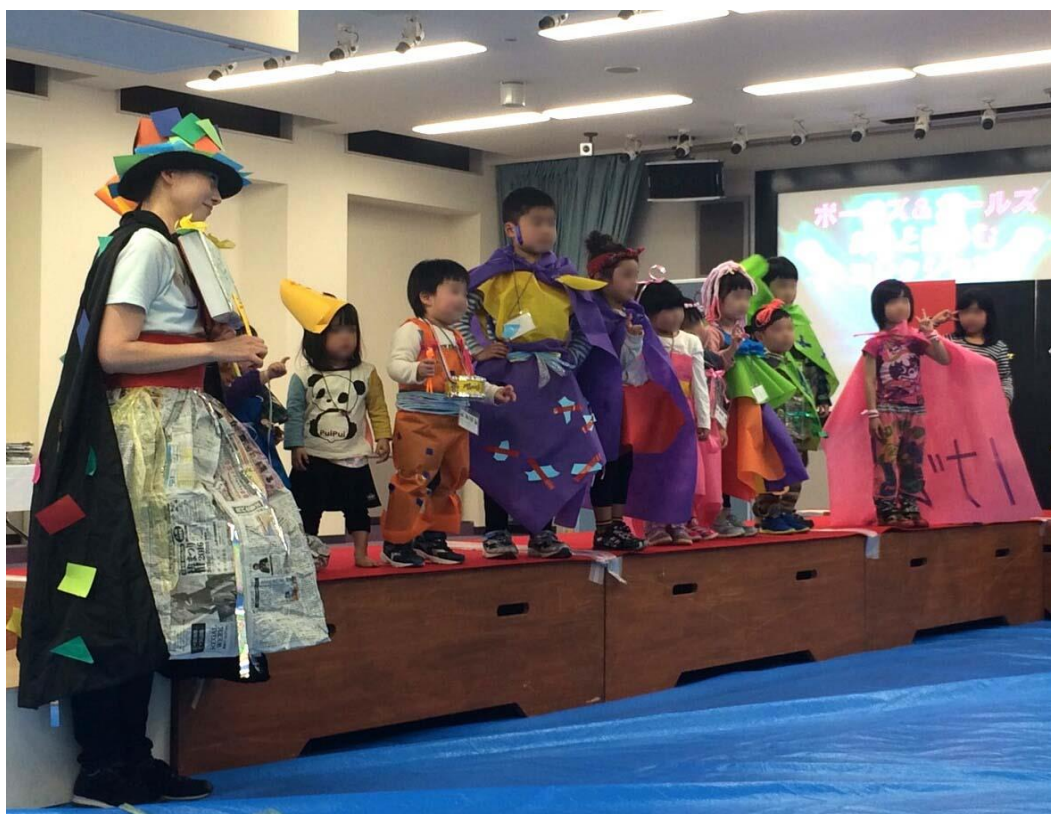
福井原子力科学館あっとほうむ春のイベントにて(2016)