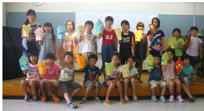
かほく市図書館主催夏休みイベント(2011)