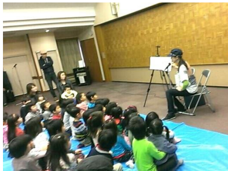
田園調布保育園父母会主催(2014)